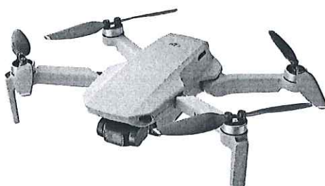
Drona DJI Mini 2, 4Kultra