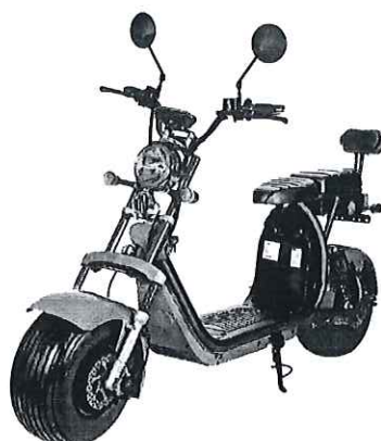
Scuter electric Trotty Hoinar